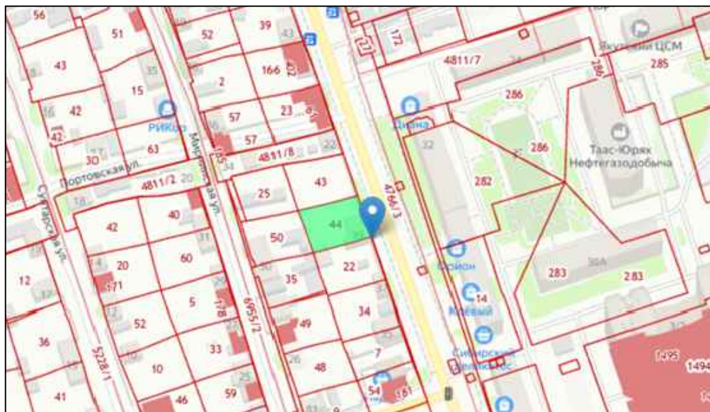
Схема 1 Земельный участок 14:14:050047:44, Адрес: Респ. Саха (Якутия) р. Ленский г. Ленск ул. Первомайская, дом 41

Кадастровый номер земельного участка 14:14:050047:44. Площадь земельного участка 807,00 кв. м. Земли поселений (земли населенных пунктов).